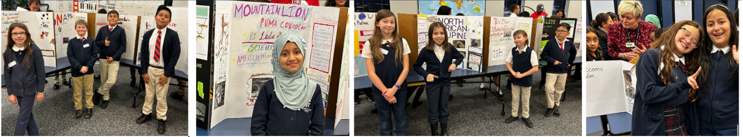
4 th Grade enthusiastically shared their animal research projects this week! American Prep-West Valley 1: 801-839-3613 / Website @ https://westvalley1.americanprep.org/