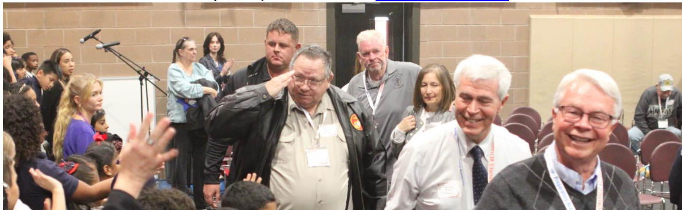
Celebración del Día de los Veteranos del lunes - Paseo de Honor